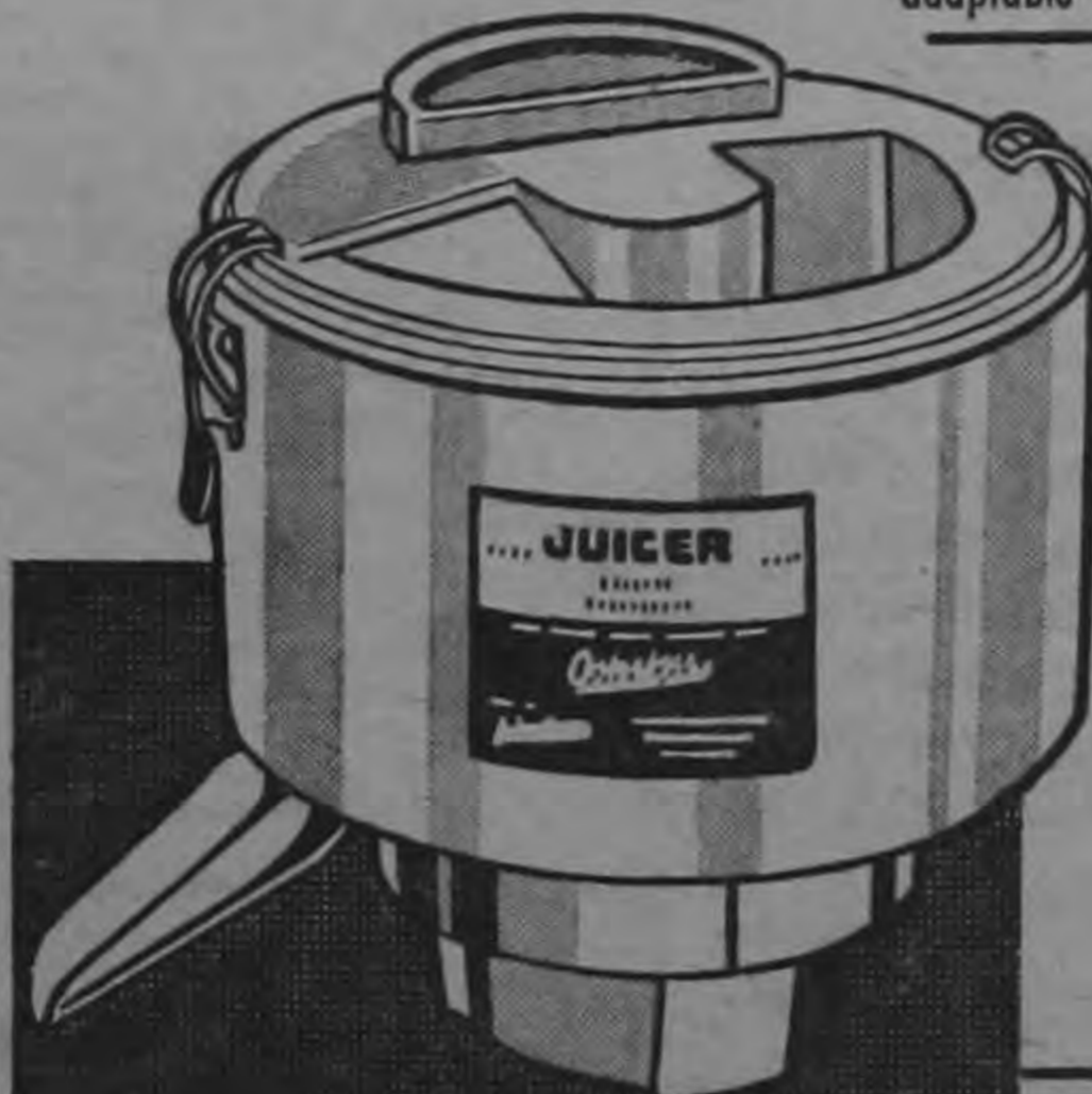
Disco extractor de jugos