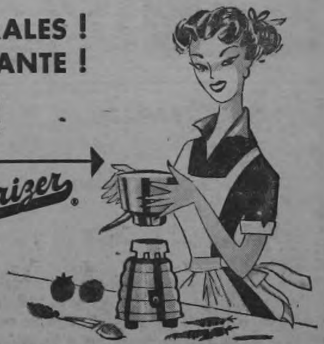
Disco para rabanar

Zanahorias, remolachas, papayas, mangos, tomates, peras, uvas, etc., dan en un segundo hasta la última gota de jugo, sin bagazo. El extractor de jugos OSTER adaptable a su OSTERIZER, sirve, además, para REBANAR Y RALLAR.